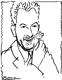
Τὸ σχέδιο τοῦ Πάμπλο Πικάσσο « Ὁ ἄνθρωπος μὲ τὸ γαρίφαλο » ἔγινε ἀπὸ φωτογραφία τῆς δίκης στὶς 31 Μαρτίου τοῦ 1952, μία μέρα μετὰ τὴν ἐκτέλεση τοῦ Ν. Μ.